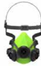
Respiradores semi faciales BLS SGE46