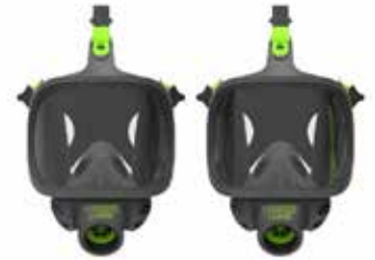
Respiradores de cara completa BLS 3400 - BLS 3150 (V)