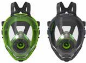
Respiradores de cara completa BLS 5400 - BLS 5150