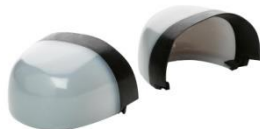
Puntera no metálica