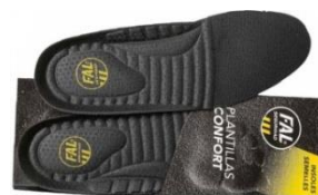
Plantillas extraíbles. Lavable