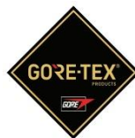
Membrana del forro impermeable + transpirable