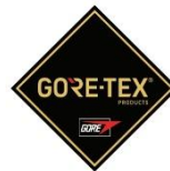
Membrana del forro impermeable + transpirable