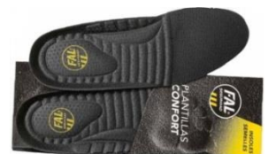
Plantillas extraíbles. Lavable