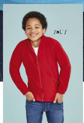
NORTH KIDS 00589